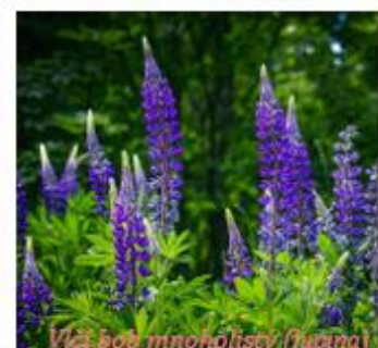
Vlčí bob mnoholistý (lupina)